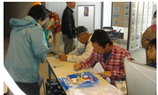
ぐんま環境森林フェスティバル 10.23

上記まとめは、地球温暖化防止活動推進センターによる推進員派遣として行った取り組みですが、そのほかにも、推進員さんが独自に様々な活動をされています。地域と連携して省エネクッキングを行ったり、自ら新エネルギーの利用実践をしていたり、企業内での温暖化防止に努めていたり、多くの推進員さんが、県内各地で草の根活動を展開しています。そのような活動を、もっと広げ県内の温暖化防止推進のためにみなさんで頑張っていきましょう。