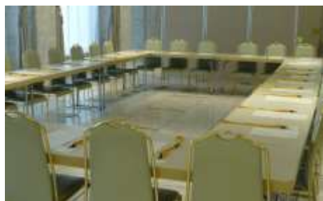
地区別交流会会場

研修会終了後は、各地区に分かれての交流会。地域ごとの初顔合わせで、自己紹介と意見交換を行ったあと、各地区の代表者と連絡方法が決まり、今期の活動が始まりました。委嘱期間は平成31年3月まで。エコサポも頑張りますので、一緒にやってみましょう！